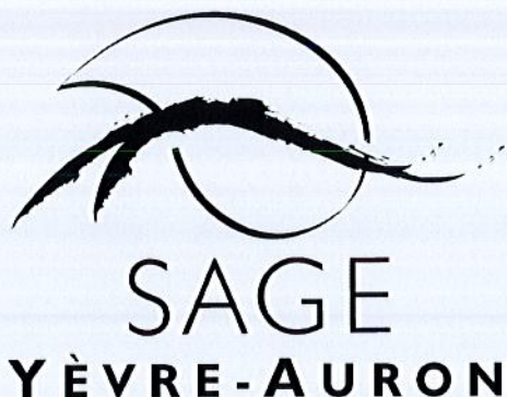
SCHÉMA D'AMÉNAGEMENT ET DE GESTION DES EAUX DES BASSINS DE L'YÈVRE ET DE L'AURON